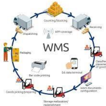
Warehouse management system