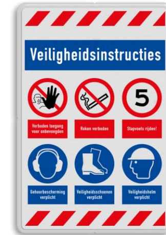
Pictogrammen in een magazijn