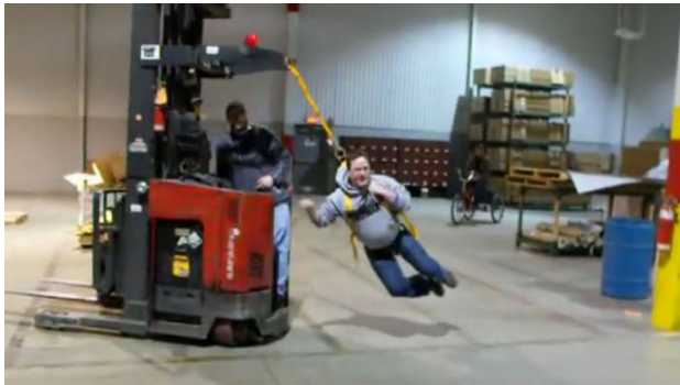
De gevaren in een magazijn